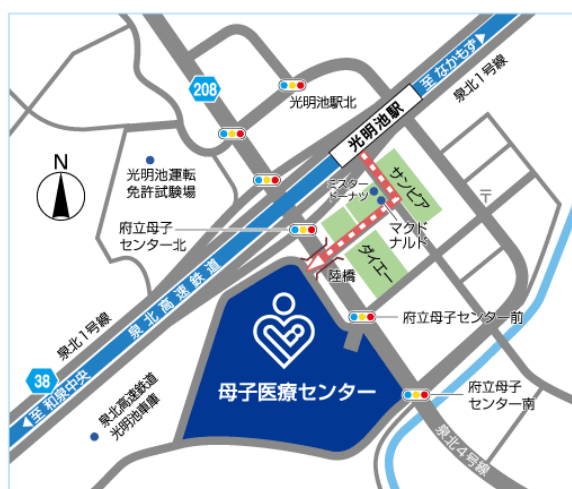
泉北高速鉄道 光明池駅 徒歩 5分