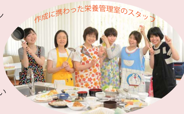
作成に携わった栄養管理室のスタッフ

本書は、当センターが取り組んできたケトン食の理論と継続のためのコツ、患者さんの病態とご家族の食生活に合わせて適切かつ簡単に実施できるケトン食のレシピをたくさん掲載しています。治療のためにケトン食を必要とする患者さんにご家族、それを支援する医療・福祉関係の皆様には是非お読みいただきたい1冊です。