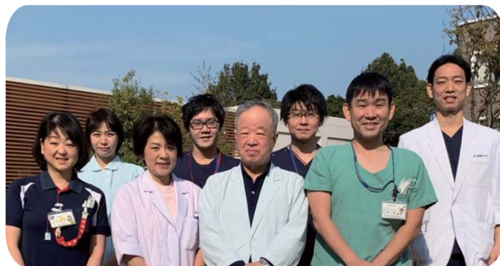
口腔外科スタッフ

の3つが大きな治療の柱となります。このため、私たち口腔外科では、口腔外科医、言語聴覚士、矯正歯科医の専門職が同じ場所で一体となって診療に当たっています。病院としてこのような体制を取っているのは全国でも当センターだけであり、この点が私たちの最も大きな強みとなっています。