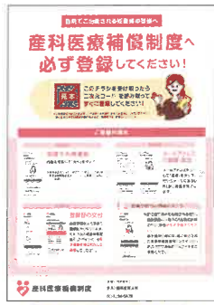
妊産婦登録用チラシ

妊産婦登録用チラシに記載の手順に沿って、 スマートフォンにてご登録ください。 ※紙の登録証にご記入のうえ登録する場合、 分娩機関を通じてご提出ください。